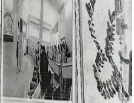
GDC Students attending lecture on flag day