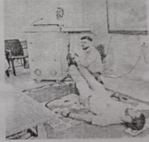
राजकीय महाविद्यालय राइलाघाट में जानकारी देते हुए ट्रेनर का व्याख्यान कि ऐसे व्याख्यान के आयोजन से विद्यार्थियों को हेल्थ इमरजेंसी की स्थिति से निपटने के बेहतर मूर सीखने का अवसर मिलता है। (रंस)